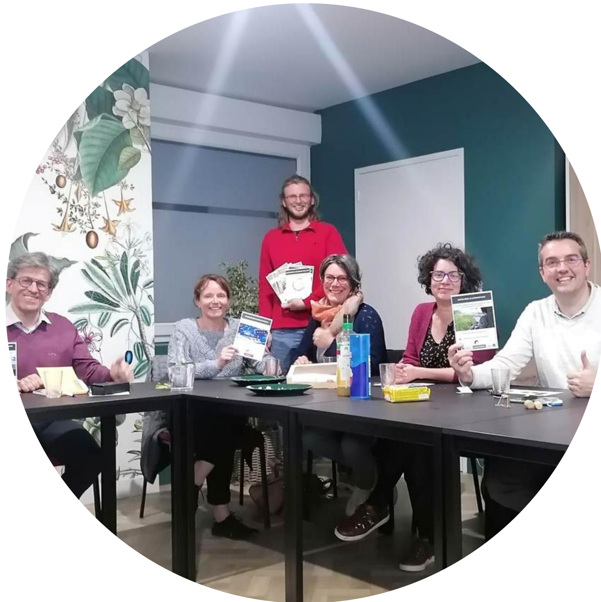
Atelier de sensibilisation au développement durable