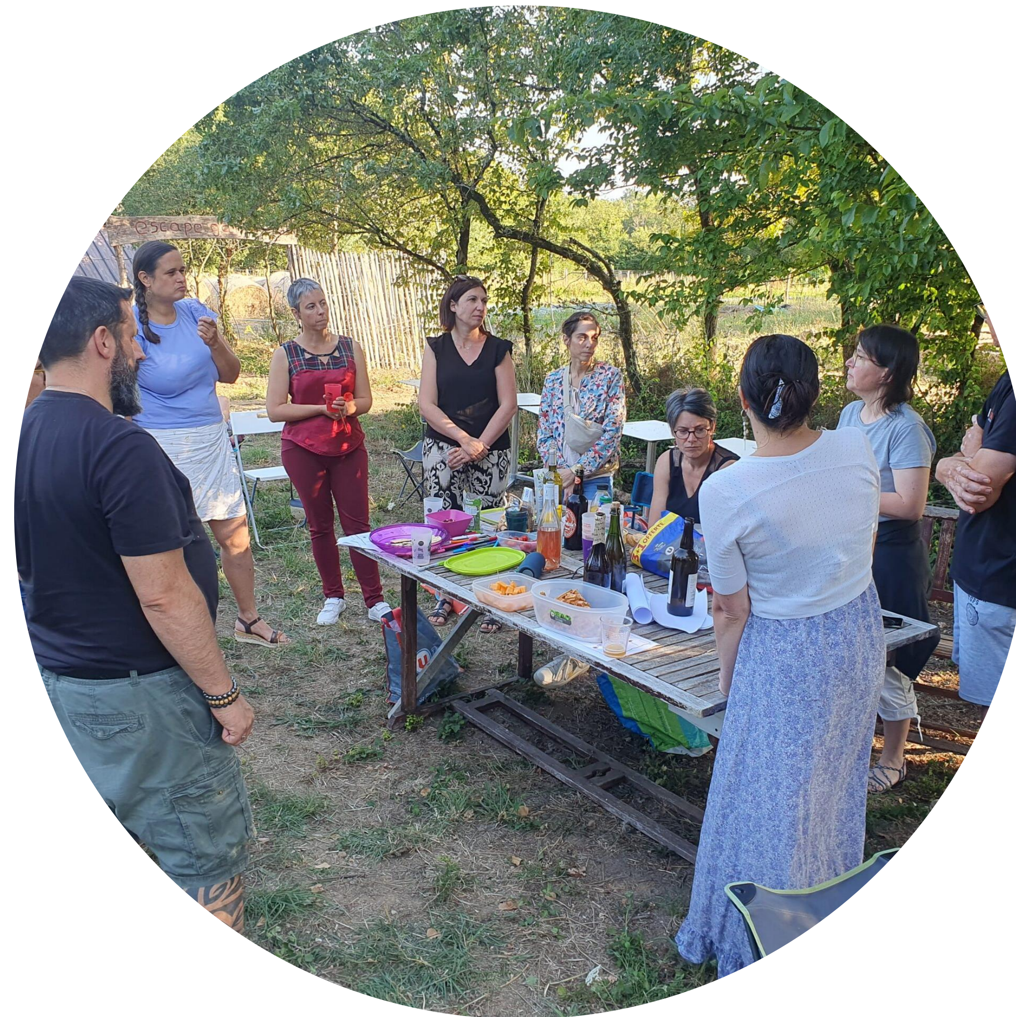
Afterwork aux jardins d'eau douce